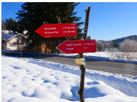
Smerna tabla za Veliki Osolnik