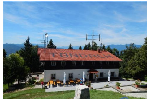
Gora Oljka 773 mnv

Dobimo se v nedeljo 18. aprila 2021 ob 08.00 uri na parkirišču za jamo Pikel.