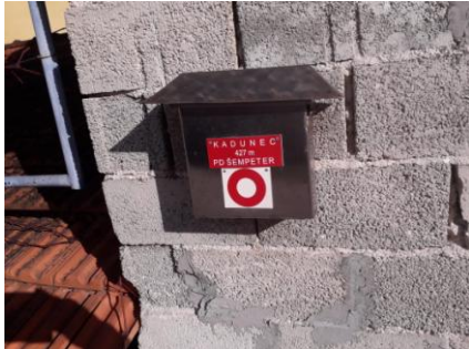
Kadunec 427 mnv