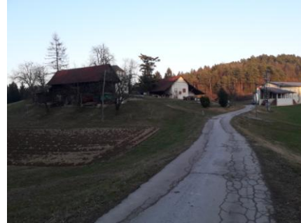
Korber 409 mnv