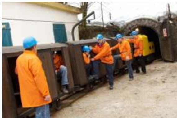
vstop v rudarski vlak

Pa smo zopet na zaključku 6. sezone ljubiteljev četrto in ob enem tudi naš jubilejni 70. Izlet. Zato je prav, da ga realiziramo na primeren poseben način. Peljali se bomo na Koroško v Mežico, kjer se bomo sprehodili po podzemlju Pece v rudniku svinca in cinka. Ogled bomo začeli z vožnjo na pravem rudarskem vlakcu, si ogledali zanimivosti podzelja in tudi srečali Berkmandelca. Sprehod v podzemlju bo skupno z vožnjo trajal 2 uri. Za muzejski ogled bomo prispevali 9,5 €.