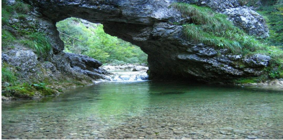
SOTESKA IŠKEGA VINTGARJA

IZHODIŠČE: P V IŠKEM VINTGARJU ČAS HOJE: 1-5 ur