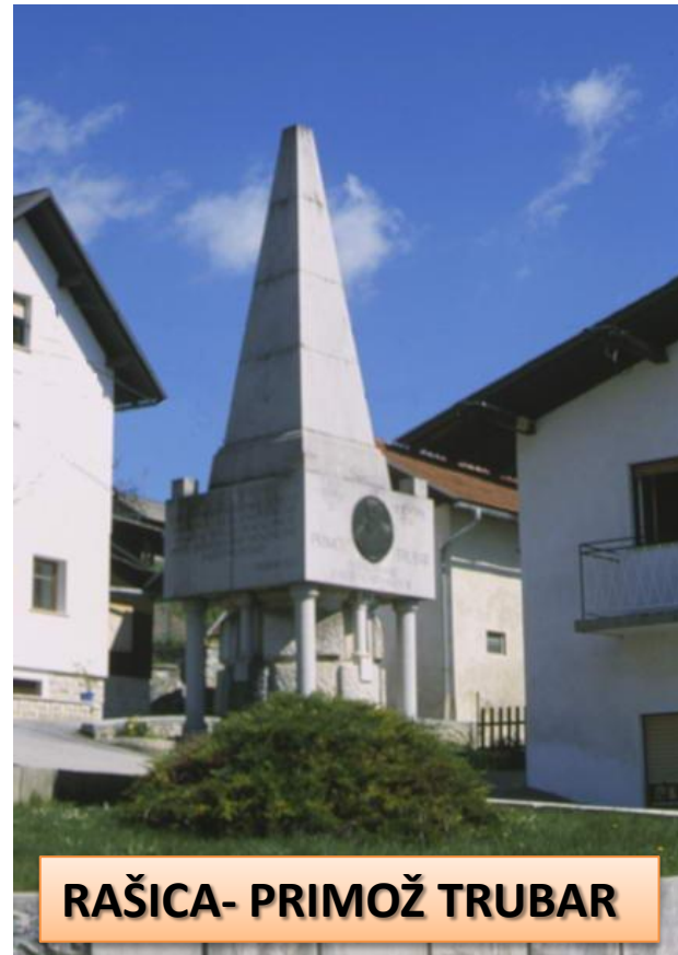
RAŠICA- PRIMOŽ TRUBAR