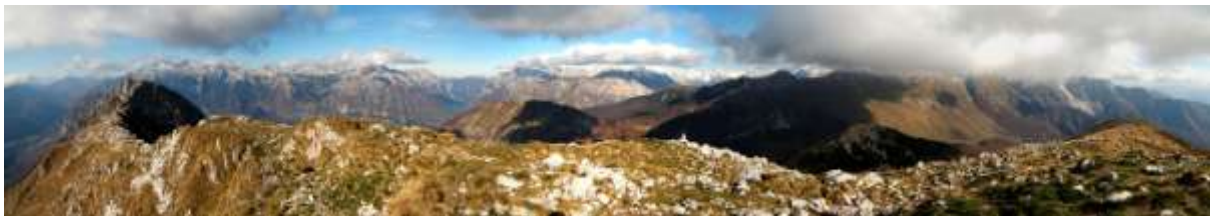
RAZGLED Z VRHA

S Krasjega vrha pa se okoli in okoli širi eden najlepših pogledov po Posočju in še daleč naprej. Lahko vidite morje – tudi izliv Soče, Benečijo z Matajurjem, Dolomite, prav vse najvišje Julijce. Največ pa je neba, ki je tiho še ob svojem najmilejšem smehljaju, kakor da varuje.