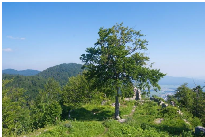
Foto: Vrh Fridrihštajna