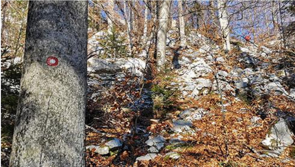
Foto: Južni pristop na Mestni vrh

S Požganega hriba vodi pot proti Ledeni jami oziroma h koči PD. Vendar se mi vrnemo po isti poti nazaj na gozdno cesto in po njej levo, mimo gozdarske kočice, navzdol do odcepa v levo in navzgor na vlako. Sledimo oznakam in kmalu pridemo do odcepa, kjer pelje pot h koči PD, mi pa sledimo desni, v smeri Mestnega vrha. Pod vznožjem preide vlaka v stezo, ki nas popelje po južni strani proti vrhu. Ko pridemo do prvih razvalin bunkerjev, ki so jih zgradili Italijani v 2. svetovni vojni, smo na vrhu 1034 m visokega Mestnega vrha. »ŽIG«