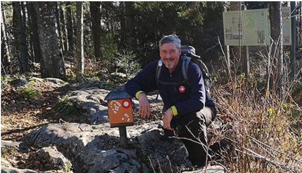
Foto: Na vrhu Mestnega vrha