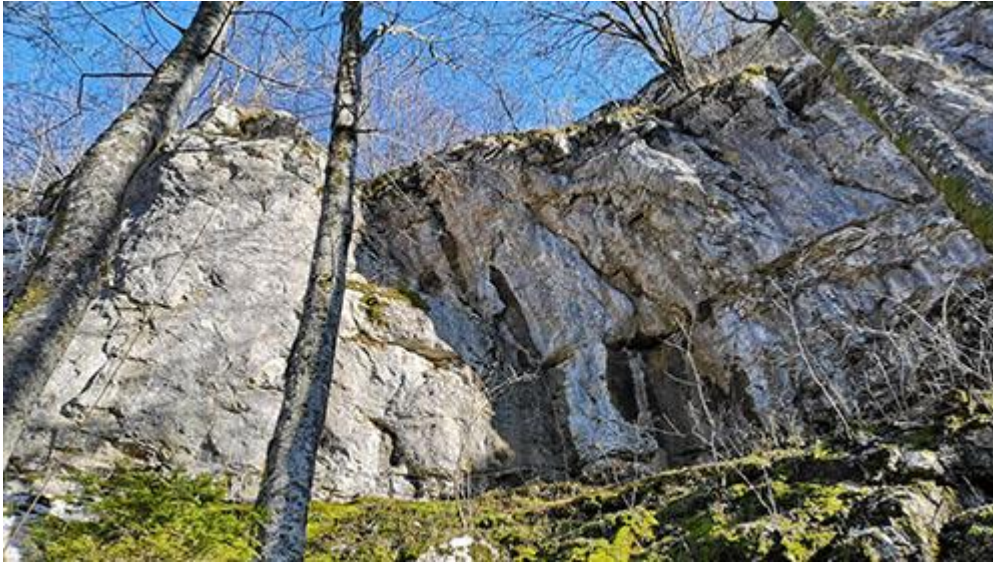
Foto: Ostenje Fridrihštajna