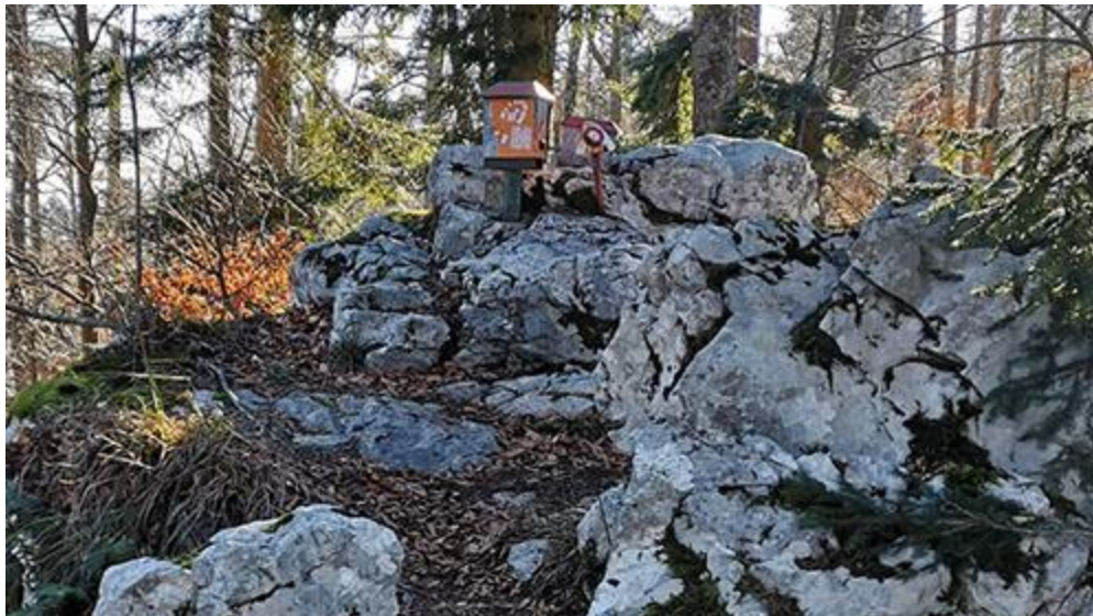
Foto: Livoldski vrh

Z razgledišča so lepi razgledi na Kočevsko polje, ter naprej proti Kočevski Mali gori, Zasavskemu pogorju ter Kočevskemu Rogu.