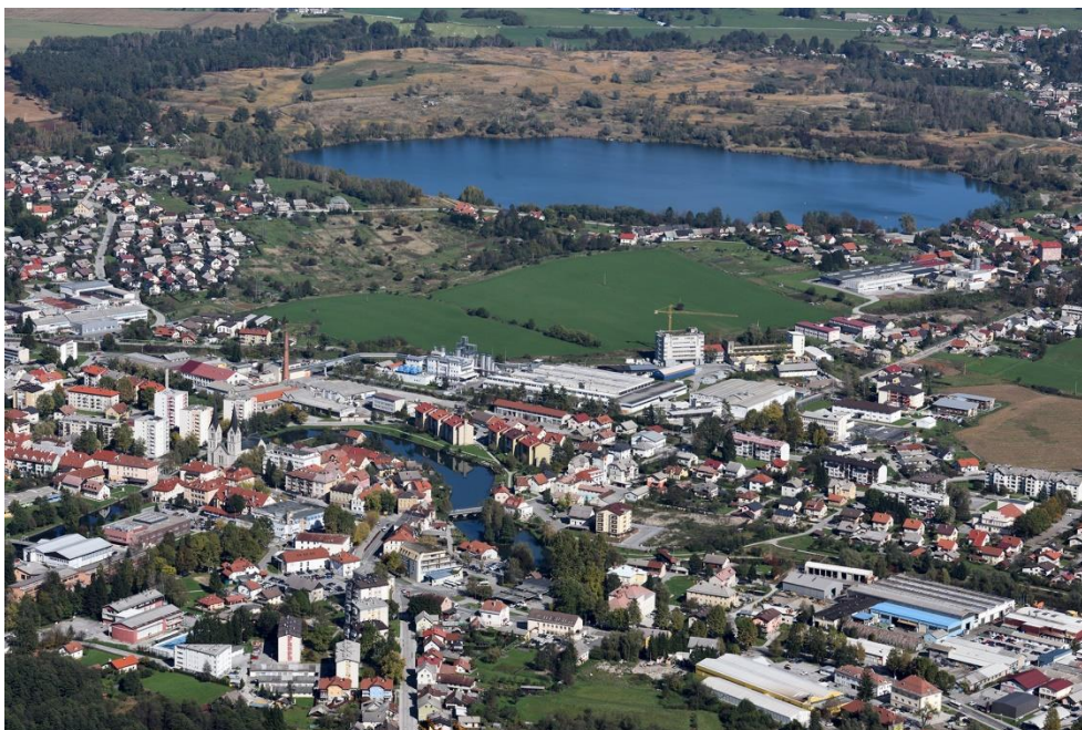
Foto: Pogled na mesto Kočevje