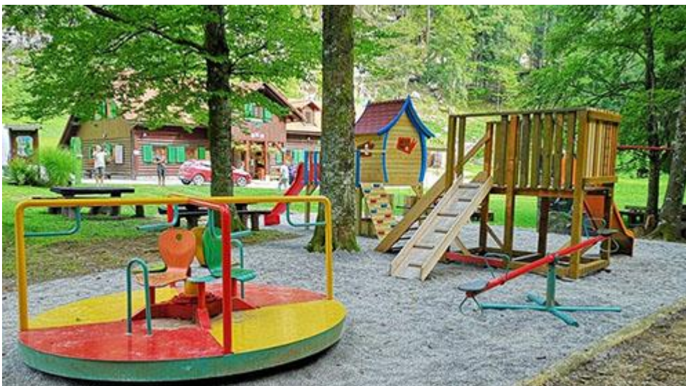
Foto: Otroško igrišče v senci dreves