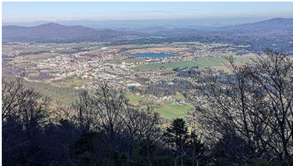
Foto: Pogled na Kočevsko polje