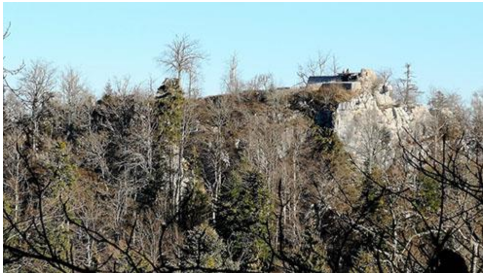
Foto: Pogled s Požganega hriba na razvaline gradu