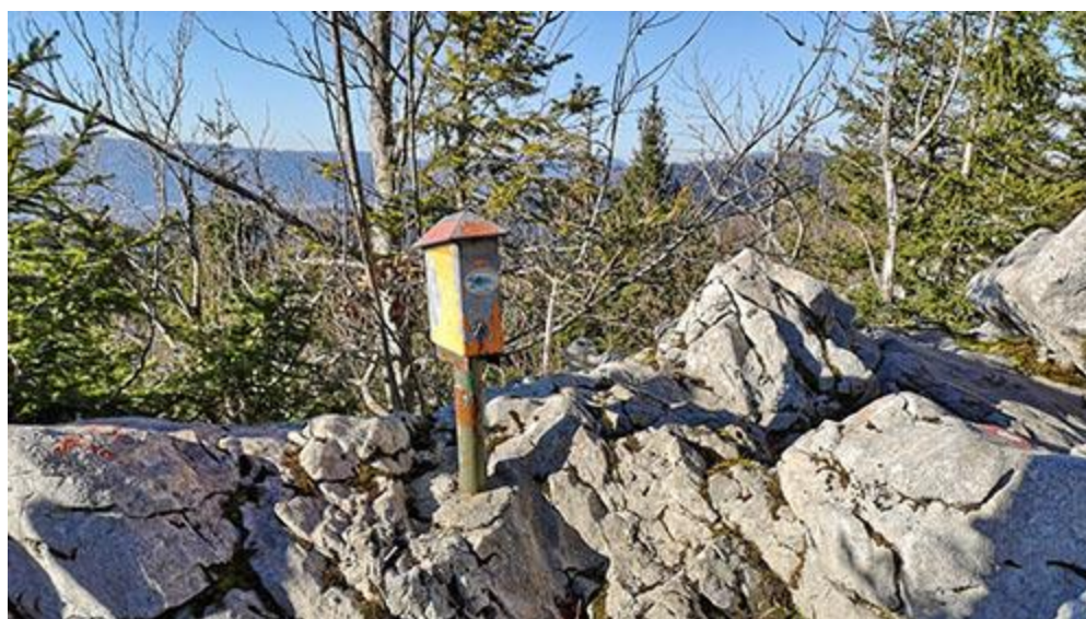
Foto: Na vrhu Požganega hriba