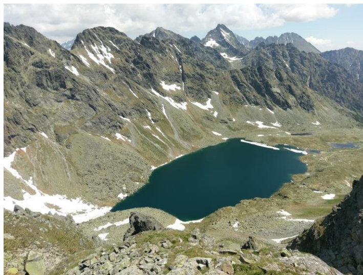
Rysy in Gerlachovsky štiti s Koprovsky štít