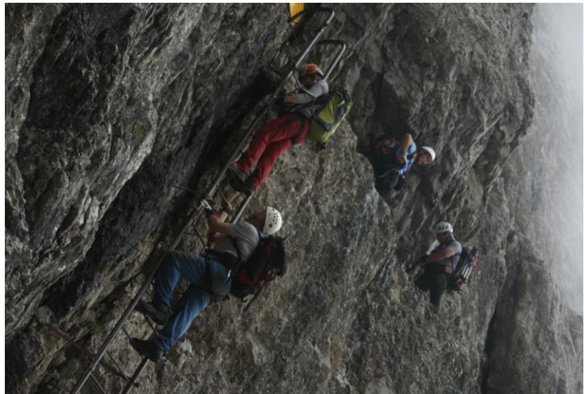
Lestve bodo naše spremljevalke ves čas

Zraven osnovne gorniške opreme in oblačil obvezno potrebujete še naslednjo opremo: zaščitno čelado, plezalni pas, samovarovalni komplet, pomožna vrvica, dve vponki z matico in rokavice za ferate . Tehnično opremo si lahko sposodite v društvu, kar morate navesti ob prijavi.