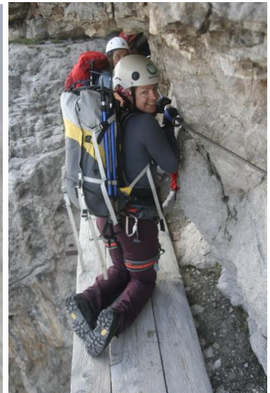
Police, ki jih ne zmanjka